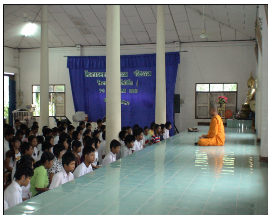
โครงการอบรมคุณธรรม จริยธรรม