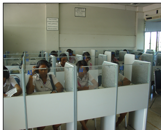
ปรับปรุงห้องปฏิบัติการทางภาษา