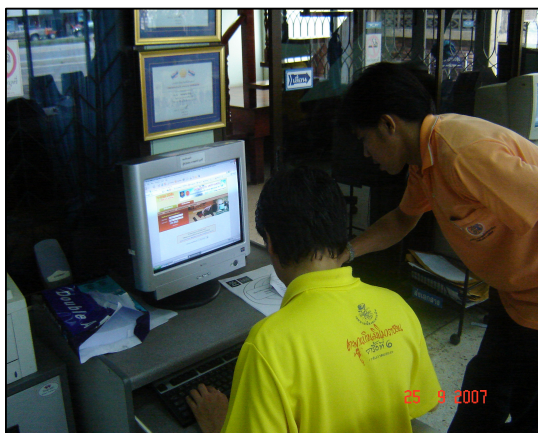
โครงการความร่วมมือระหว่างสถานศึกษากับ สถานประกอบการ