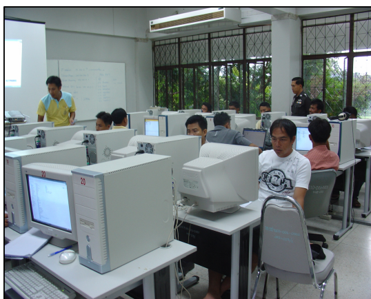
สอนหลักสูตรระยะสั้น วิชาคอมพิวเตอร์เบื้องต้นฯ