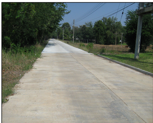
การเทพื้นถนนคอนกรีตภายในวิทยาลัยฯ