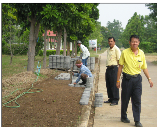
โครงการปูพื้นถนนทางเท้าในวิทยาลัยฯ