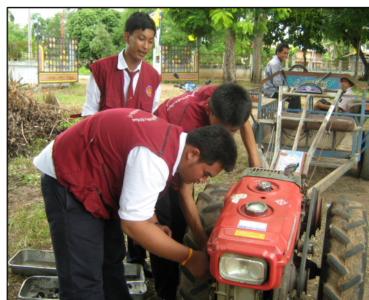
โครงการอาสาบริการ ร่วมกับอำเภอเคลื่อนที่