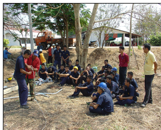
การจัดการเรียนในรายวิชา การติดตั้งไฟฟ้านอกอาคาร