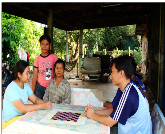
โครงการเยี่ยมบ้านนักเรียน นักศึกษา