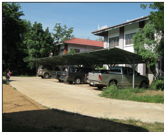
การปรับปรุงถนนคอนกรีตและโรงจอดรถบ้านพักครู