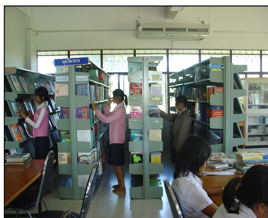
จัดหาหนังสือวารสารเข้าห้องสมุด