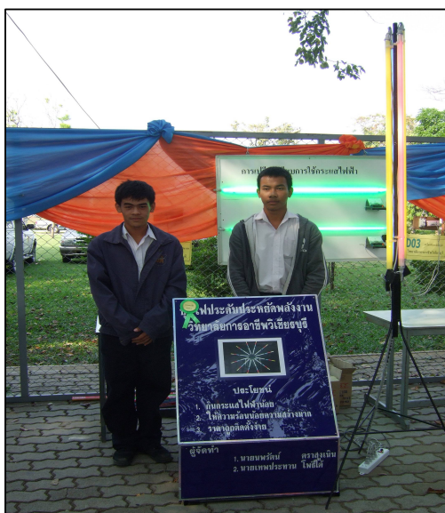
ไฟประดับประหยัดพลังงาน