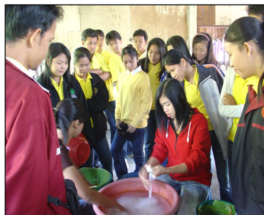
นักเรียนเข้าร่วมกิจกรรมภูมิปัญญาท้องถิ่น การทำขนมจีน