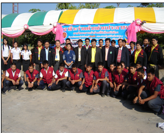
โครงการอาสาช่วยด้วยช่วยประชาชนเทศกาลวันปีใหม่