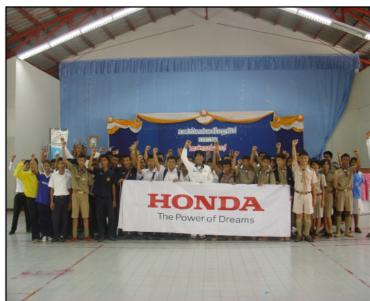
อบรมขับขี่ปลอดภัยและทำใบอนุญาตขับขี่