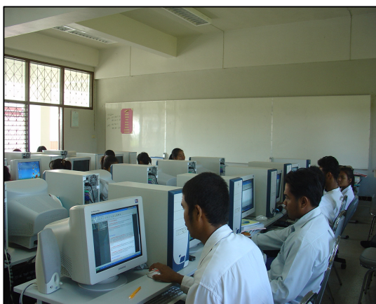
โครงการปรับปรุงห้องปฏิบัติการคอมพิวเตอร์