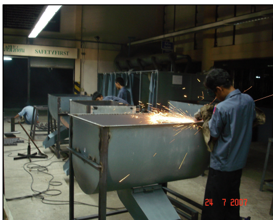
การหารายได้ระหว่างเรียนของนักศึกษา ในการผลิต เครื่องอัดปุ๋ยชีวภาพอัดเม็ด