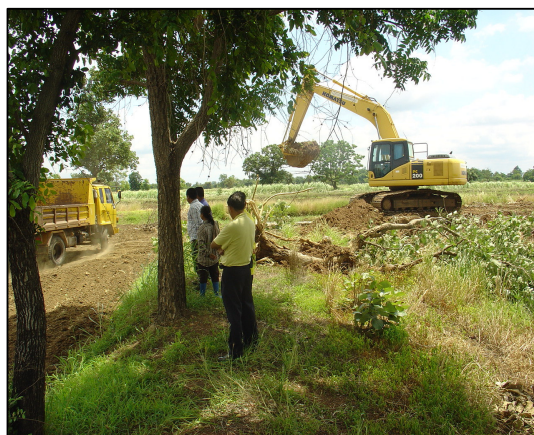
โครงการปรับพื้นที่ค่างระดับเพื่อสร้างโรงอาหารหลังใหม่