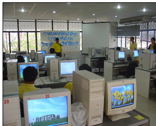
โครงการอบรมการจัดทำบทเรียน E-Learning