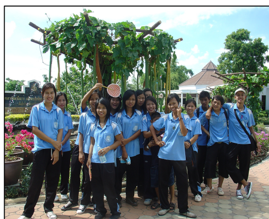
กิจกรรมทัศนศึกษาอุทยานที่ บึงฉลวก จ.สุพรรณบุรี