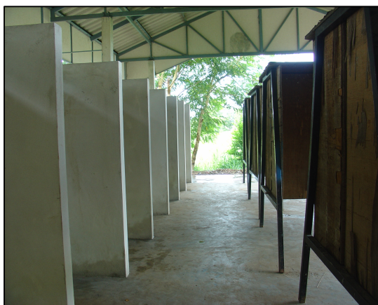
โครงการจัดทำบู๊ตเดินสายไฟคอนกรีต