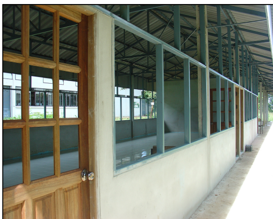
การจัดทำห้องเรียนการอาครชั่วคราวเพิ่มเติม