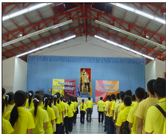
กิจกรรมวันพ่อแห่งชาติ