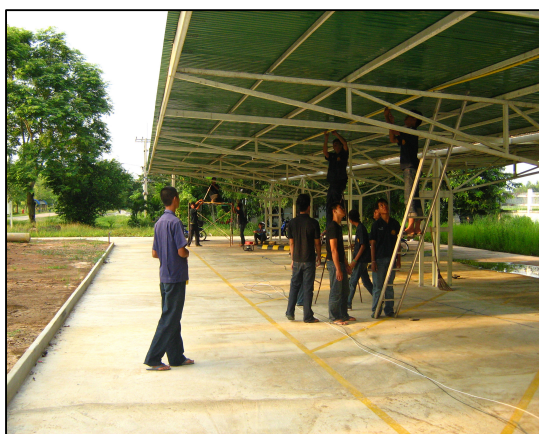
การติดตั้งและการซ่อมแซมระบบไฟฟ้าภายในวิทยาลัยฯ