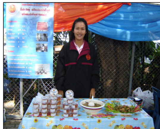
พริกแกงอบแห้ง