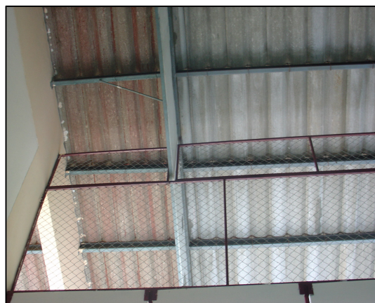
การจัดทำตาข่ายกันนก