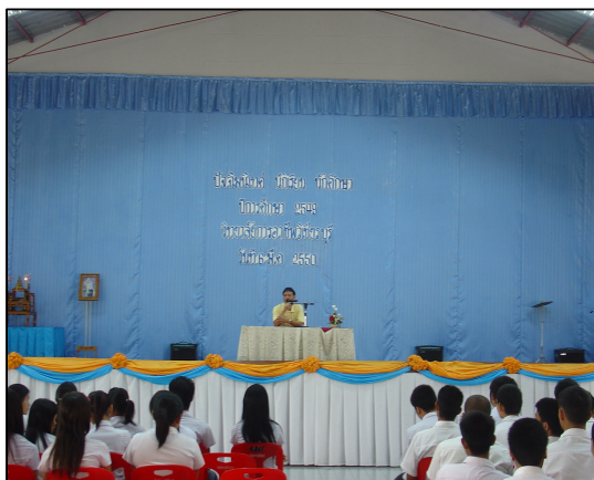
โครงการปัจฉิมนิเทศ