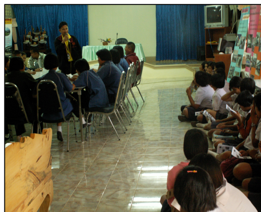
โครงการแนะนำเส้นทางสู่อาชีพ