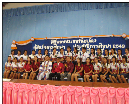
โครงการพิธีมอบใบประกาศนียบัตร