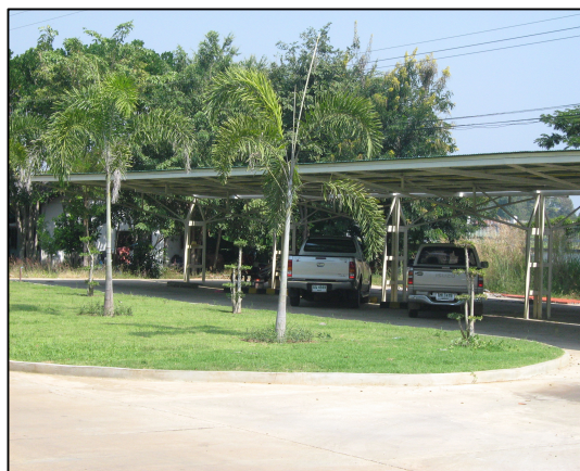
การจัดทำโรงจอดรถหลังใหม่