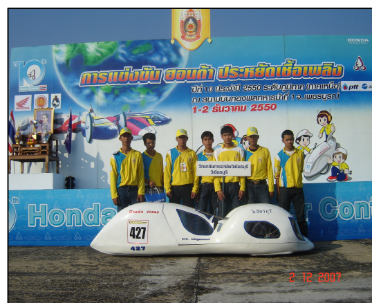
รถประหยัดเชื้อเพลิง