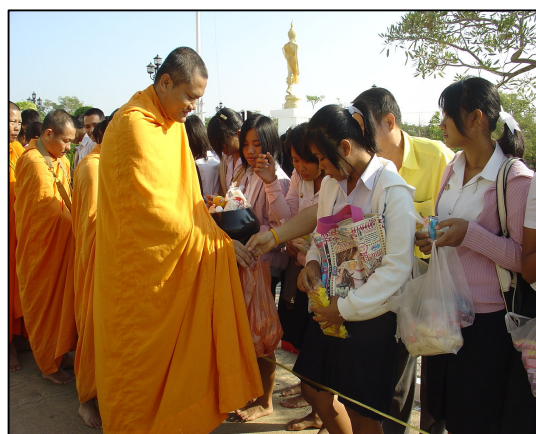
กิจกรรมทำบุญตักบาตรวันปีใหม่ 2550