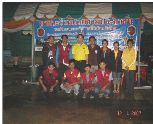
โครงการอาสาช่วยด้วยช่วยประชาชนเทศกาลสงกรานต์