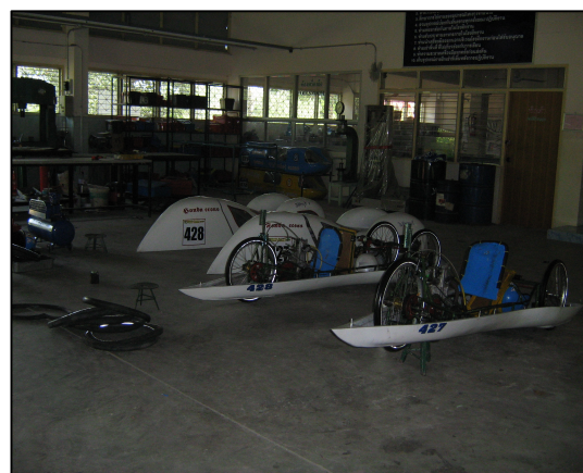
โครงการปรับปรุงรถประหยัดเชื้อเพลิง