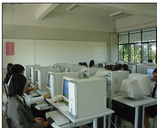
โครงการเปลี่ยนกระดานดำเป็นไวท์บอร์ด