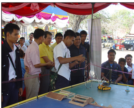
โครงการแข่งขันหุ่นยนต์