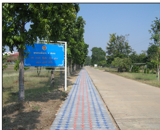
การจัดทำป้ายประชาสัมพันธ์ ป้ายรณรงค์ภายในวิทยาลัยฯ