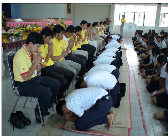
กิจกรรมวันไหว้ครู