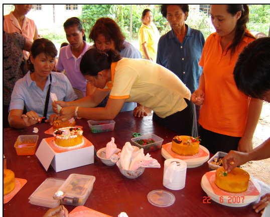
โครงการเผยแพร่แนวคิดกรมบริการชุมชน (108 อาชีพ)