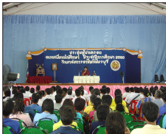
โครงการปฐมนิเทศและประชุมผู้ปกครอง