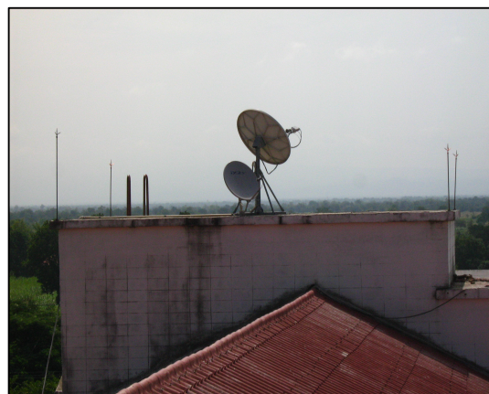
จัดทำระบบล่อฟ้าของวิทยาลัยฯ