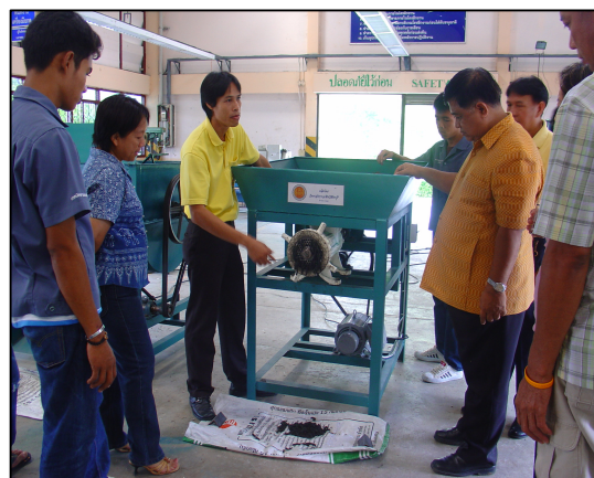
“เครื่องอัดปุ๋ยชีวภาพอัดเม็ด” 1 วิทยาลัย 1 ผลิตภัณฑ์