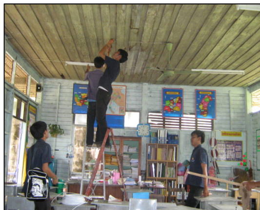
โครงการสำรวจระบบไฟฟ้าภายในโรงเรียนในสังกัด สพฐ.