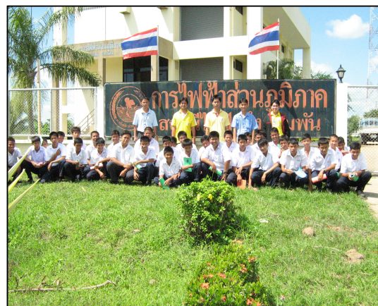
โครงการทัศนศึกษาดูงาน นักศึกษา ชั้นปีที่ 1