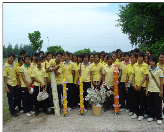
กิจกรรมถวายเทียนพรรษา