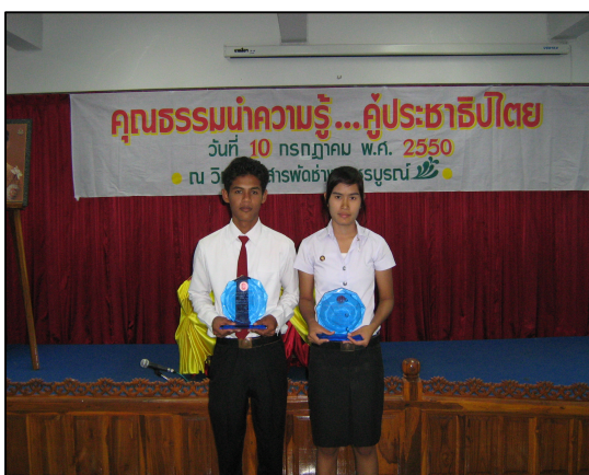
โครงการคุณธรรมนำความรู้ คู่ประชาธิปไตย