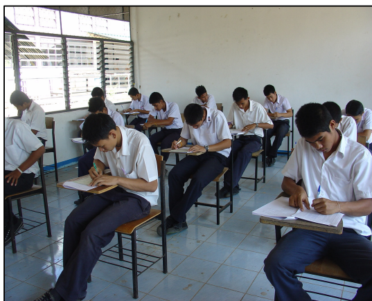
โครงการทดสอบมาตรฐานวิชาชีพ