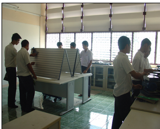
การปรับปรุงห้องเรียนแผนกเทคนิคพื้นฐาน