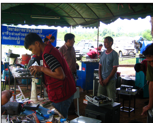
โครงการอาสาบริการช่วยเหลือผู้ประสบอุทกภัย บ้านโป่งสามขา ต.ศิลา อ.หล่มเก่า จ.เพชรบูรณ์