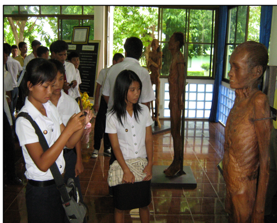
กิจกรรมทัศนศึกษาอุทยานวัดถ้ำกระบอก