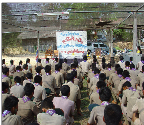
โครงการเข้าค่ายพักแรมลูกเสือวิสามัญ