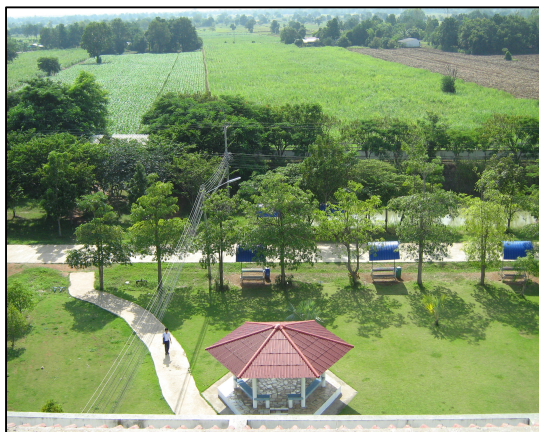
การปรับปรุงภูมิทัศน์วิทยาลัยของงานอาคารสถานที่